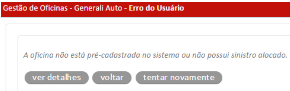
Figura 5 - Tela de erro

Caso o CNPJ da oficina não esteja pré-cadastrado ou o sinistro não exista na base do sistema, será apresentada a seguinte mensagem.