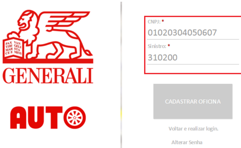
Figura 4 - Cadastro de oficina

Caso o sistema localize o sinistro vinculado ao CNPJ informado o usuário será direcionado a pagina de cadastro de oficinas.